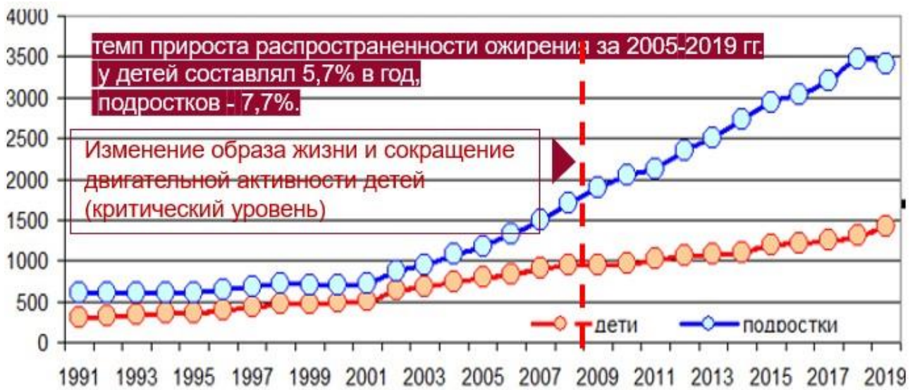
Рисунок - 2. Распространенность ожирения у детей и подростков по РФ в динамике за 1991-2019 гг. (на 100 тыс. нас.)